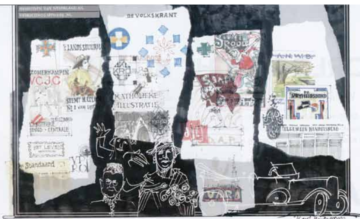
De Verzuiling, 1918-1928.

de noodzaak om 1 mei 1909 een nationale tijd in te voeren werd nog niet gelegd. Het is nou eenmaal niet praktisch om treinen te laten rijden door verschillende tijdzones, en toen het kwartje viel begon een leerlinge te grinniken: "Heeft Nederland nog maar zo kort een gemeenschappelijke tijd?" En dat was precies wat ik dacht toen ik de plaat maakte."