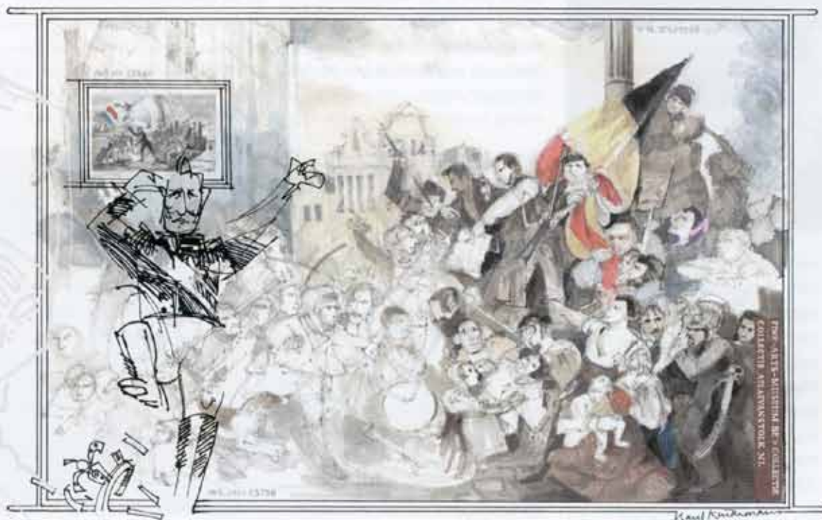
De Belgische Opstand, 1830.

Tekenaar Karel Kindermans heeft, in opdracht van Atlas Van Stolk, een nieuwe serie schoolplaten gemaakt die niet alleen maar weergaven van historische gebeurtenissen zijn, maar moeten worden bekeken als 'beeldessays'. In één tekening zijn verschillende gebeurtenissen samengebracht die met elkaar in verband staan. De platen zijn gemaakt en uitgegeven ter gelegenheid van de herdenking van tweehonderd jaar koninkrijk en hebben dus betrekking op de afgelopen twee eeuwen. Gebundeld in het boekje Beeldkraken is elke plaat voorzien van een toelichting door een professional: van de directeur van Atlas Van Stolk via universitair docenten tot geschiedenisdocenten en vakdidactici. Voor de platen heeft Kindermans bestaande beelden gebruikt, die in Atlas Van Stolk, in andere collecties en op internet te vinden zijn. Die heeft