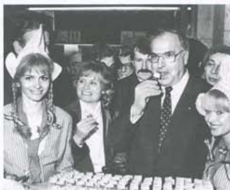
De Nederlandse maagd als Frau Antje.

De Nederlandse maagd ontleedt beelden, zoomt in en uit en trekt op het eerste oog meer en minder voor de hand liggende parallellen. Van der Woldes kijk-en-vergelijkmethode werkt aanstekelijk. Maar soms leidt die wel tot al te rappe conclusies en matige onderbouwingen. Voor de bewering dat de