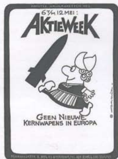
ILLUSTRATIES UIT DE NEDERLANDSE MAAGD

vrouw in Volendammer kostuum en het kaasmeisje Frau Antje min of meer de Nederlandse maagd in klederdracht belichamen, valt best wat te zeggen. Maar de auteur laat nergens echt zien hoe het ene beeld uit het andere voortkwam. Waar is die missing link?